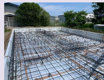
基礎断熱と耐震等級3の鉄筋配筋