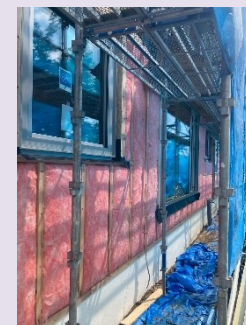
付加断熱施工中の様子