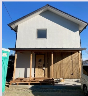
木外壁と塗り壁の落ち着いた雰囲気の外観